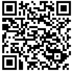
Line Official Account